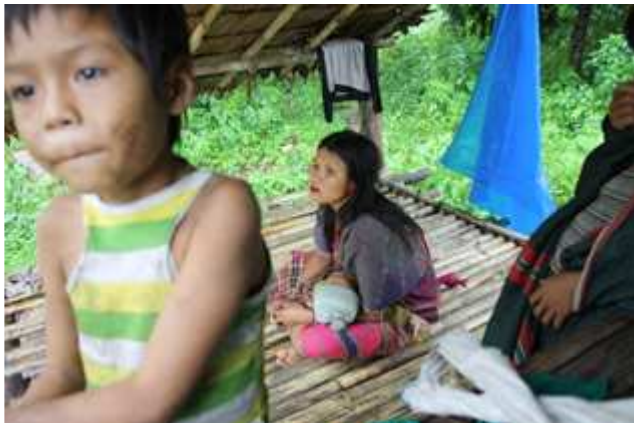
တၢ်ဂီၤတဘျီအံၤဘၣ်တၢ်ဒိၣ်အီၤဖဲလါယူၤလံ ၃သီ ၂၀၀၉န့ၣ် ဟံၣ်ဖျါဝဲဟံၣ်ဖိယီၤဖဲလါတဖၣ်အၢၣ် တဒုၣ် ဟဲယုာ်န့ၣ်ဝဲသဝီတဖျါအပူၤဖဲကျိၣ်တဲာ်ကီၢ်ဆါန့ၣ်လီၤ. ဘၣ်ဆၣ် အဝဲသ့ၣ် ဆဲးမၤ အိၣ်ဒီးအတၢ်မၤအိၣ်လီၤလၢအအိၣ်လၢ ကညိၣ်ကီၢ်ခဲၣ်ပူၤဒီး လၢ လါယူၤလံလံၤ က့ၤမၤအိၣ် က့ၤဝဲတဘျီလၢဘၣ်ခိဖျါလၢ ပျံၤဝဲ နအဖဒီးဒံၣ်ခ့ၣ်ဘၣ်အုၣ်တၢ်မၤအါမၤထီၣ် တဖၣ်အယီၤ န့ၣ်လီၤ. (တၢ်ဂီၤ-ခ့ၣ်အုၣ်အၢၣ်က့ၣ်)

ဖဲလါယူၤလံတဝၣ်န့ၣ်, ကျိၣ်တဲာ်ပုၤဘၣ်မုၢ်ဘၣ်ဒါတဖၣ်ဆါတဲာ်ဝဲလၢပုၤဘၣ်ကိဘၣ်ခဲဖိတဖၣ်တၢ်တမၤဆူၣ်အဝဲသ့ၣ်လၢကက့ၤလီၤဆူၣ်ကီၢ်ပ ယီၤမ့တမ့ၢ်သုးအသးဆူၣ်လဲးဘၣ်, ဒီးတၢ်ကဟ့ၣ်ခွဲးယံလၢ ကဘၣ်အိၣ်ဖဲတၢ်လီၤသီအံၤတၢ် တၢ်စူၤခါကတီၢ်လၢန့ၣ်လီၤ. ဖဲ လါအီၤကူး ၂၆သီန့ၣ် “ကွၢ်ကလုာ်” ဟံၣ်ဖျါဝဲလၢတၢ်မၤဆူၣ်ဟံၣ်န့ၣ် ၂၆န့ၣ်လၢကဘၣ်ဟးထီၣ်ကွၢ်လၢနီၤဘိန့ၣ်လီၤ. ဟံၣ်န့ၣ်တဖၣ်တမ့ၢ်ပုၤအသီလၢအ ဟဲယီၤဖဲလါဂၤဟံၣ်န့ၣ်ဘၣ်. မ့ၢ်ဒၣ်ဟံၣ်ဖိယီၤဖဲလါအဟဲယုာ်အိၣ်လၢ တလးအီၤကျါ ဒီး ချၢၣ်ခိၣ်သဝီ ကျိၣ်တဲာ် ဖဲကီၢ် ဆါလၢအပူၤကွၢ်ခံန့ၣ် န့ၣ်ဘၣ်ဆၣ်က့ၤမၤအိၣ်ဒီးအစံၣ်လၢကီၢ်ပယီၤပူၤန့ၣ်လီၤ. ခိဖျိပျံၤဘၣ် မ့ၢ်ပိာ်,တၢ်ထီၣ်ဒုးဒီး တၢ်ထၢဆူၣ်သုးအယီၤသဝီဖိတဖၣ် က့ၤလီၤဝဲတ ဘျီလၢဘၣ်ဒီး ကွၢ်ဆါမဲာ်ဘၣ်က့ၤဒီးတၢ်အိၣ်တၢ်ဂ့ၢ်ကိ အယီၤယုာ်အိၣ်က့ၤဝဲလၢ နီၤဘိသဝီန့ၣ်လီၤ. ဒီးဟံၣ်န့ၣ် ၂၆န့ၣ်အံၤက့ၤလီၤဆူၣ်ကီၢ်ပ ယီၤ မ့တမ့ၢ်အိၣ်တုာ်ဒီးဒၣ်လၢကီၢ်ခါန့ၣ် ခ့ၣ်အုၣ်အၢၣ်က့ၣ်မၤလီၤတံာ်ဝဲတန့ၢ်ဒီးဘၣ်န့ၣ်လီၤ. တၢ်မၤဆူၣ်အဝဲသ့ၣ်ဟးထီၣ်ဝဲအလီၤခံ လွံာ် သီန့ၣ်ဒံၣ်ခ့ၣ်ဘၣ်အုၣ်(၉၉၉)အသုးဖိဟဲခိယီၤဝဲသ့ၣ်ကျိၣ်ဒီးလဲၤန့ၣ်ဝဲဆူၣ်ချၢၣ်ခိၣ်သဝီ ဖဲလါအီၤကူး ၃၀သီ မုၢ်န့ၣ် အနၢ်ရံၣ် (၁၀) န့ၣ်လီၤ. သ ဝီဖိတဖၣ်ဒီးန့ၣ်ဘၣ်ဝဲတၢ်ကစီၣ်လၢ ဒံၣ်ခ့ၣ်ဘၣ်အုၣ်ကဟဲန့ၣ်အယီၤ ယုာ်အိၣ်လၢတၢ်လီၤ အဂၤတချုးဒံၣ်ခ့ၣ်ဘၣ်အုၣ်သုးတဟဲန့ၣ် ဒီးဘၣ်အခါ န့ၣ်လီၤ. ဒံၣ်ခ့ၣ်ဘၣ်အုၣ်သုးဖိတဖၣ် ခးဝဲသဝီဖိတဖၣ် ဒီးကျိၣ်ဖဲဖဲအဝဲသ့ၣ်ဟးထီၣ်က့ၤ အခါ. ဘၣ်ဆၣ်တၢ်ဘၣ်ဒီးဘၣ်ထံးတအိၣ်နီတဂၤဘၣ် န့ၣ်လီၤ. ပုၤသုးဖိတဖၣ် ဟံးအိၣ်ဟ့ၣ်ဝဲ ဆိလၢအအိၣ်လၢ သဝီပူၤတဖၣ်ယုာ်ဒီးစ့ယီၤ ၉,၀၀၀ ဘး(အဖဲရကၤစ့ ၂၆၄ဒီလၢ)လၢဟံၣ်တဖျါၣ် အပူၤန့ၣ်လီၤ. သဝီဖိတဖၣ်ဟံၣ်ဖျါထီၣ်ဝဲခဲအံၤအဝဲသ့ၣ်ဘၣ်ပျံၤဝဲလၢကဘၣ် က့ၤကဒါဆူၣ်သဝီလၢအဘူးဒီးကျိၣ်တဲာ်ကီၢ်ဆါဘၣ်ဆၣ်အိၣ်လၢ နီၤဘိသဝီပူၤတသ့ၣ်ကိးလၢဘၣ်န့ၣ်လီၤ.