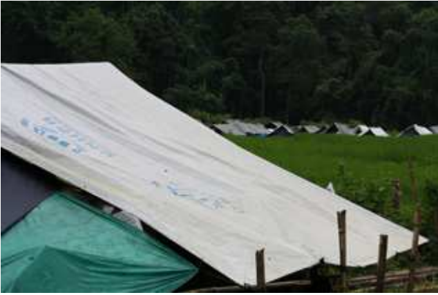
တၢ်ဂီၤတဘျီအံၤဘၣ်တၢ်ဒိၣ်အီၤဖဲလါအီၤကူး ၅သီ ၂၀၀၉န့ၣ်,ဟံၣ်ဖျါထီၣ်ဝဲတၢ်အိၣ်ကဒု တၢ်တၢ်လီၤအလီၤဖဲအူၤသ့ၣ်ထၣ်တၢ်လီၤသီဒီး ခဲခဲအံၤ ပူၤနီၣ်ဂံၢ်အိၣ်ဝဲ ၁,၉၈၈ ဂၤန့ၣ်လီၤ. တၢ်အိၣ်ကဒုအခိၣ်ဒုးတဖၣ်အတစုးအိၣ်လၢ(UNCHR)အမံၤန့ၣ်လီၤ.