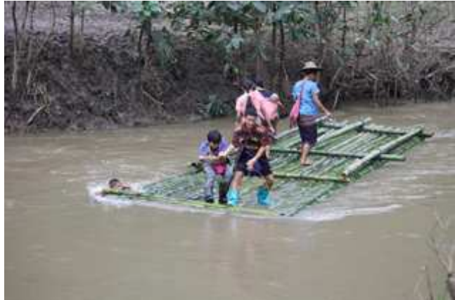
တၢ်ဂီၤတဘျီအံၤဘၣ်တၢ်ဒိၣ်အီၤဖဲလါအီၤကူး ၅သီ ၂၀၀၉န့ၣ်ဟံၣ်ဖျါဝဲပိာ်ခါတဖၣ်ဒီးဝဲဒၣ် ထီၣ်ဒီးသီးကစီၣ်ကီၢ်သ့ၣ်ကျိၣ်ဖဲ ကီၢ်ပယီၤ-ကျိၣ်တဲာ်ကီၢ်ဆါဖဲအဘူးဒီးတၢ်လီၤသီဖဲ ထၣ်စိၣ် ယါ ကီၢ်ရျၢၣ်ပူၤန့ၣ်လီၤ. ဖဲထံၣ်မုၢ်ခဲးလီၤကဒါက့ၤန့ၣ်လၢဒံၣ်ခ့ၣ်ဘၣ်အုၣ်ကမၤတၢ်ထီၣ်ဒုးအဝဲ သ့ၣ်တၢ်လီၤသီအဂီၢ်ညါထီၣ်ဝဲဒၣ်န့ၣ်လီၤ.

ဖဲလါယူၤလံတဝၣ်န့ၣ်, ကျိၣ်တဲာ်ပုၤဘၣ်မုၢ်ဘၣ်ဒါတဖၣ်ဆါတဲာ်ဝဲလၢပုၤဘၣ်ကိဘၣ်ခဲဖိတဖၣ်တၢ်တမၤဆူၣ်အဝဲသ့ၣ်လၢကက့ၤလီၤဆူၣ်ကီၢ်ပ ယီၤမ့တမ့ၢ်သုးအသးဆူၣ်လဲးဘၣ်, ဒီးတၢ်ကဟ့ၣ်ခွဲးယံလၢ ကဘၣ်အိၣ်ဖဲတၢ်လီၤသီအံၤတၢ် တၢ်စူၤခါကတီၢ်လၢန့ၣ်လီၤ. ဖဲ လါအီၤကူး ၂၆သီန့ၣ် “ကွၢ်ကလုာ်” ဟံၣ်ဖျါဝဲလၢတၢ်မၤဆူၣ်ဟံၣ်န့ၣ် ၂၆န့ၣ်လၢကဘၣ်ဟးထီၣ်ကွၢ်လၢနီၤဘိန့ၣ်လီၤ. ဟံၣ်န့ၣ်တဖၣ်တမ့ၢ်ပုၤအသီလၢအ ဟဲယီၤဖဲလါဂၤဟံၣ်န့ၣ်ဘၣ်. မ့ၢ်ဒၣ်ဟံၣ်ဖိယီၤဖဲလါအဟဲယုာ်အိၣ်လၢ တလးအီၤကျါ ဒီး ချၢၣ်ခိၣ်သဝီ ကျိၣ်တဲာ် ဖဲကီၢ် ဆါလၢအပူၤကွၢ်ခံန့ၣ် န့ၣ်ဘၣ်ဆၣ်က့ၤမၤအိၣ်ဒီးအစံၣ်လၢကီၢ်ပယီၤပူၤန့ၣ်လီၤ. ခိဖျိပျံၤဘၣ် မ့ၢ်ပိာ်,တၢ်ထီၣ်ဒုးဒီး တၢ်ထၢဆူၣ်သုးအယီၤသဝီဖိတဖၣ် က့ၤလီၤဝဲတ ဘျီလၢဘၣ်ဒီး ကွၢ်ဆါမဲာ်ဘၣ်က့ၤဒီးတၢ်အိၣ်တၢ်ဂ့ၢ်ကိ အယီၤယုာ်အိၣ်က့ၤဝဲလၢ နီၤဘိသဝီန့ၣ်လီၤ. ဒီးဟံၣ်န့ၣ် ၂၆န့ၣ်အံၤက့ၤလီၤဆူၣ်ကီၢ်ပ ယီၤ မ့တမ့ၢ်အိၣ်တုာ်ဒီးဒၣ်လၢကီၢ်ခါန့ၣ် ခ့ၣ်အုၣ်အၢၣ်က့ၣ်မၤလီၤတံာ်ဝဲတန့ၢ်ဒီးဘၣ်န့ၣ်လီၤ. တၢ်မၤဆူၣ်အဝဲသ့ၣ်ဟးထီၣ်ဝဲအလီၤခံ လွံာ် သီန့ၣ်ဒံၣ်ခ့ၣ်ဘၣ်အုၣ်(၉၉၉)အသုးဖိဟဲခိယီၤဝဲသ့ၣ်ကျိၣ်ဒီးလဲၤန့ၣ်ဝဲဆူၣ်ချၢၣ်ခိၣ်သဝီ ဖဲလါအီၤကူး ၃၀သီ မုၢ်န့ၣ် အနၢ်ရံၣ် (၁၀) န့ၣ်လီၤ. သ ဝီဖိတဖၣ်ဒီးန့ၣ်ဘၣ်ဝဲတၢ်ကစီၣ်လၢ ဒံၣ်ခ့ၣ်ဘၣ်အုၣ်ကဟဲန့ၣ်အယီၤ ယုာ်အိၣ်လၢတၢ်လီၤ အဂၤတချုးဒံၣ်ခ့ၣ်ဘၣ်အုၣ်သုးတဟဲန့ၣ် ဒီးဘၣ်အခါ န့ၣ်လီၤ. ဒံၣ်ခ့ၣ်ဘၣ်အုၣ်သုးဖိတဖၣ် ခးဝဲသဝီဖိတဖၣ် ဒီးကျိၣ်ဖဲဖဲအဝဲသ့ၣ်ဟးထီၣ်က့ၤ အခါ. ဘၣ်ဆၣ်တၢ်ဘၣ်ဒီးဘၣ်ထံးတအိၣ်နီတဂၤဘၣ် န့ၣ်လီၤ. ပုၤသုးဖိတဖၣ် ဟံးအိၣ်ဟ့ၣ်ဝဲ ဆိလၢအအိၣ်လၢ သဝီပူၤတဖၣ်ယုာ်ဒီးစ့ယီၤ ၉,၀၀၀ ဘး(အဖဲရကၤစ့ ၂၆၄ဒီလၢ)လၢဟံၣ်တဖျါၣ် အပူၤန့ၣ်လီၤ. သဝီဖိတဖၣ်ဟံၣ်ဖျါထီၣ်ဝဲခဲအံၤအဝဲသ့ၣ်ဘၣ်ပျံၤဝဲလၢကဘၣ် က့ၤကဒါဆူၣ်သဝီလၢအဘူးဒီးကျိၣ်တဲာ်ကီၢ်ဆါဘၣ်ဆၣ်အိၣ်လၢ နီၤဘိသဝီပူၤတသ့ၣ်ကိးလၢဘၣ်န့ၣ်လီၤ.