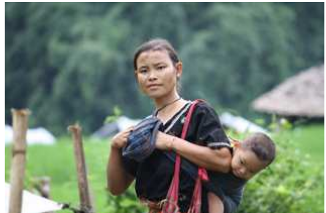
တၢ်ဂီၤတဘျီအံၤဘၣ်တၢ်ဒိၣ်အီၤဖဲ လါအီၤကူး ၅သီ ၂၀၀၉န့ၣ် ဟံၣ်ဖျါဝဲပိာ်မုၢ်ပုၤညါဘီဒီး အဖိခါတဂၤဟးထီၣ်ဝဲလၢတၢ်လီၤသီတၢ်လီၤဒီးသီးကက့ၤမၤန့ၣ်အိၣ်က့ၤတၢ်အိၣ်အိၣ်တၢ်လၢ အသဝီဖဲအဘူးဒီးကီၢ်ပယီၤ-ကျိၣ်တဲာ်ကီၢ်ဆါန့ၣ်လီၤ. အသဝီန့ၣ်အိၣ်လၢ ကျိၣ်တဲာ်ကီၢ်ပူၤ ဘၣ်ဆၣ် အဝဲယုာ်ပူၤဖျါအသးဒီးဒံၣ်ခ့ၣ်ဘၣ်အုၣ်သုးဖိ အိၣ်လၢကညိၣ်ကီၢ်ခဲၣ်ပူၤဒီး ဟဲခိ ယီၤ ထံးန့ၣ်လီၤဆူၣ်ကျိၣ်တဲာ်ကီၢ်ပူၤအယီၤန့ၣ်လီၤ.

ပုၤဘၣ်ကိဘၣ်ခဲဖိအိၣ်လၢ တၢ်လီၤသီတဖၣ် တအိၣ်ဒီးသုးအသးဆူၣ်လဲးခဲကဝီၤဘၣ်ခိဖျါလၢ အဝဲသ့ၣ် မုၢ်လၢဝဲလၢ ကက့ၤအိၣ်က့ၤလၢ အ ဟံၣ်အယီၤဒီး ဟံၣ်ဖျါထီၣ်စ့ၢ်အတၢ်ဘၣ်ယိၣ်အိၣ်လၢ အနီၢ်ကစၢ်တၢ်ဘၣ်တၢ်ဘၢခိဖျါဘၣ်ယိၣ်ဝဲလၢ ဒံၣ်ခ့ၣ်ဘၣ်အုၣ်ကဟဲထီၣ်ဒုးဘၣ်ဖုး အအိၣ် တၢ်လီၤခဲအံၤန့ၣ်လီၤ. တၢ်လီၤသီအံၤ စီၤစူၤဒၣ်ခဲန့ၣ်ရံၣ်ကျဲးဒီး ကီၢ်ဆါဒီးတၢ်မ့ၢ်တစူၤလၢဘၣ်ဒီးထံၣ်မုၢ်လီၤကဒါက့ၤန့ၣ်ကျဲးညါထီၣ်ဝဲဒၣ်န့ၣ် လီၤ. ဒ်တၢ်ထီၣ်ဒုးဟဲထီၣ်လၢအပူၤကွၢ်ဖဲလါယူၤအါရံၤ ၂၀၀၉န့ၣ်န့ၣ်ခ့ၣ်အုၣ်အၢၣ်က့ၣ်ဒီးန့ၣ်ဘၣ်တၢ်ဟံၣ်ဖျါယုာ်ဘၣ် ယးဒံၣ်ခ့ၣ်ဘၣ်အုၣ် ဒီးနအဖ ခးလီၤကျိၣ်ဖဲဒီးလီၤတဲာ်ဆူၣ်ကျိၣ်တဲာ်ကီၢ်ပူၤအဂ့ၢ်န့ၣ်လီၤ. တၢ်ဂ့ၢ်ဟံၣ်ယုာ်စ့ၢ်ကိး ဒီးတၢ်ဒုးဟဲထီၣ်အသးလၢ ဒံၣ်ခ့ၣ်ဘၣ်အုၣ်သုးဆူ