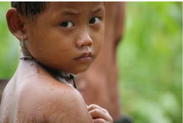
တၢ်ဂီၤတဘျီအံၤ, ဘၣ်တၢ်ဒိန့ၣ်အိၣ်ဖဲလၢအိၣ်ကူး ၅၁၁ ၂၀၀၉နံနံ, ပၤဖျါထီၣ်ပၤဖျါဝဲဖဲသၣ် တဂၤဖဲအုၣ်ထီၣ်တၢ်လီၤသီလၢဘၣ်ကီၢ်ဘၣ်ခဲလၢလၢပၤဟၢလီၤအိၣ်ကမ့ၣ်ဒဲကဝီၤဖဲအစီၢ် ဖဲဖၣ်အုန်ကီၢ်ရၢၣ်ပူၤန့ၣ်လီၤ. လၢ ပုၤ ၄,၈၆၂ အကျါန့ၣ် ၂,၁၄၅ န့ၣ် မုၢ်ဝဲဒၣ် ဖိသၣ်လၢ အသးန့ၣ်အိၣ် ၁၂န့ၣ်အဖိလၢတဖၣ်န့ၣ်လီၤ.

ဘူးထီၣ်လၢပူၤ ၅,၀၀၀ ယုၤပူၤဖျါဒီးအသးလၢတၢ်သဘၣ်သဘၣ် ဒီးတၢ်မၤအၢမၤသီဖဲဖၣ်အုန်ကီၢ်ရၢၣ်ပူၤစးထီၣ်လၢပူၤဒီးဒုးခွန် ဘၣ်အုန်သုးန့ၣ်ပၤဖျါတဘျီအသးမၤတၢ်ထီၣ်ဒုးကညီတၢ်ထုၣ်ဖျါဒုးသုး မုၢ်ဒိၣ် (ခွန်အဲၣ်အဲၣ်လဲအုန်) အတၢ်လီၤဖဲအဘူးဒီးလၢပၤဟၢ ကီၢ်ပူၤလီၤအိၣ်ကမ့ၣ်ဖဲအဲၣ်က ဝီၤဖဲတြၢၤကီၢ်ဆၢအမုၢ်ထီၣ် ပူၤန့ၣ် လီၤ. တၢ်ထီၣ်ဒုးစးထီၣ်အသးဖဲလၢယူၤ ၂၁၂၀၀၉နံနံန့ၣ်လီၤ. ဒီးတၢ်လီၤဆူ လၢယူၤ ၇၁၁န့ၣ် ပုၤသဝီဖိ အိၣ်န့ၣ် ၃၀၀၀၀လၢ ပၤဖျါ လၢပၤဟၢ ဟဲကဝီၤဒီးတဘျီယုၤန့ၣ်အုၣ်ကီၢ်တဲာ်ပူၤ န့ၣ်လီၤ. ဖဲလၢ ယူၤ ၁၃၁၁န့ၣ် နအဖဒီးဒုးခွန်ဘၣ်အုန် မၤန့ၣ်ဝဲ ခွန်အဲၣ်အဲၣ်လဲ အုန် သုး(၇)အလီၤခါၣ်သး သုးရၢၣ်(၁၀၁),(၂၁) ဒီး(၂၂)အသးကလၢတဖၣ်န့ၣ်လီၤ.