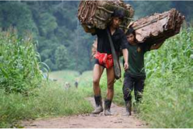
တၢ်ဂီၤအံၤတၢ်ဒိန့ၣ်အီၤဖဲ လါအီကူး ၅သီ ၂၀၀၉န့ၣ်, ဒုးန့ၣ်ဖျါဝဲ ဖိၣ်ခါတဖၣ်ယိးန့ၣ်လၢဒုး ဟံၣ်ခိၣ် လၢ ကညီယိၤကီၢ်ကစၢ်ခိၣ်သဝီ ဖဲထံန့ၣ်ထၣ်သဝီန့ၣ်လီၤ. တန့ၣ်ညါလါ အီကူးအံၤ မူခိၣ်တစူၣ်ဖးဒိၣ်ဒဲးညီန့ၣ်အသိးဘၣ်, ဘၣ်ဆၣ်လၢတဖၣ်မ့ၢ်တၢ်အကါဒိၣ်လၢလီၤဟံၣ် က ဝီၤတၢ်ဟ့ၣ်ကသံၣ်တဖၣ်အဂီၢ်လီၤ.

နအဖဒီးဒံၣ်ခ့ၣ်ဘၣ်အုၣ်သုးဖိတဖၣ် ယုဆူၣ် သဝီဖိတဖၣ် ကကဲအပူၤဝဲတၢ်ဖိ, ဝံန့ၣ်တၢ်ပိးတၢ်လီၤ ဟံၣ်ယုၣ်တၢ်အိၣ်ဒီးကျိချံၣ်ပြၣ်သ့ၣ်, ဒိန့ၣ်စ့ၢ်ကိး ကဘၣ်လဲၤတၢ်လၢအသုးကျိၤမဲၣ်ညါဒိးသိးကမၤရဲၤမၤပျီမ့ၣ်ပိၤန့ၣ်လီၤ. ဖဲဝၣ်မံၤကျါသဝီ, တၢ်တြီၤကီၢ်ဆၣ် ပူၤသဝီဖိ(၁၀၀)ဂုၣ်ကျဲၤစၢၤအိၣ်ဝဲ တုၤလါယူၤလၢဒိးသိး ကတၢၢ်သကိး နအဖဒီးဒံၣ်ခ့ၣ်ဘၣ်အုၣ်အတၢ်ယုဆူၣ်လၢအဝဲသ့ၣ်ဖိခိၣ်တဖၣ်န့ၣ်လီၤ. ဖဲလါယူၤဘူးကလၢဒိးန့ၣ် သဝီ ဖိလၢအိၣ်တၢ်တဖၣ် သ့ၣ်ညါဝဲလၢ မၤတၢ်လၢအကစၢ်ဂီၢ်ဒိးသိး ကမၤန့ၣ်အနီၢ်ကစၢ်ဂီၢ်ခိၣ်တၢ်လိၣ်တဖၣ်တသုးဒီးတကတီၢ်ယီၤ ဘၣ်မၤလၢပုၤန့ၣ် နအဖဒီးဒံၣ်ခ့ၣ်ဘၣ်အုၣ်တဖၣ်အတၢ်မၤဆူၣ်မၤစိးန့ၣ်မၤဝဲတန့ၣ်လၢတက့ၤလၢဘၣ်န့ၣ်လီၤ. ဖဲလါယူၤအသိး ၂၀န့ၣ်သဝီဖိတဖၣ်စးထီၣ်ယုၣ်ဝဲ ဒၣ်န့ၣ်လီၤ. စ့ၢ်သိတချူးလၢ သဝီဖိတဖၣ် တယုၢ်ဒီးဘၣ်နအဖဒီးဖိလၢ အအိၣ်သုလီၤအသးဖဲ ကတဲၣ်သုးကလၢတဖၣ် ဟ့ၣ်လီၤ တၢ်က လုၢ်လၢ သဝီဖိတဂၤကဘၣ်လဲၤမၤန့ၣ်အတၢ်လၢ တဟ့ၣ်ဝဲအလုၢ်အပူၤဘၣ်န့ၣ်လီၤ. သဝီဖိအံၤဆိကမိၣ်ဒီးတဲဝဲလၢ အဝဲကဘၣ်မၤတၢ်သၢသိ ဒီး ကချူး န့ၣ်တၢ်ဆၢကတီၢ်လၢ ကယုၢ်တဘျီယီဒီး အသဝီဖိအဂၤတဖၣ်အယီၤသဝီဖိန့ၣ် ကန့ၣ်ဝဲနအဖတၢ်ကလုၢ်န့ၣ်လီၤ. ဒီးအဝဲဘၣ်တၢ်မၤ ဆူၣ်အီၤလၢ ကမၤတၢ်လၢ ဒိတန့ၣ်န့ၣ်လီၤ. ဆၢကတီၢ်လၢ အဝဲဖဲက့ၤတုၤလၢအဟံၣ်တဘျီ, အသဝီန့ၣ်ပူၤတအိၣ်လၢနီတဂၤဘၣ်. ဖဲတသ့ၣ် ညါဝဲလၢ ကဘၣ်မၤဒဲးလဲၣ်ဒီးကဘၣ်လဲၤဖဲလဲၣ်အခါန့ၣ် အဝဲဒံၣ်ခ့ၣ်ဘၣ်အုၣ် လၢကဒုးကဲထီၣ်အိၣ်ဒီးသုးဖိန့ၣ်လီၤ. တန့ၣ်ဝဲအလီၢ်ခံ, အဝဲယု အခွဲးလၢ ကဟဲက့ၤဟးလၢအသဝီန့ၣ်လီၤ. ဒီးအဝဲယီၤဘၣ်ပုၤလၢဘၣ်တၢ်ဒီးလီၤအီၤလၢ ဒံၣ်ခ့ၣ်ဘၣ်အုၣ်သုးဖဲအဝဲတအိၣ်အခါန့ၣ် လီၤ. ဒံၣ်ခ့ၣ်ဘၣ်အုၣ်စိၣ်ကွဲၣ်အီၤဝဲဒီးခ့ၣ်အုၣ်အၣ်က့ၣ်ပူၤထၢတၢ်ကစိၣ်ဖိမၤလီၤတံၢ်ဝဲအတၢ်ဘၣ်ဒိဘၣ်ထံးတၢ်အိၣ်သးတန့ၣ်လၢဘၣ်န့ၣ်လီၤ.