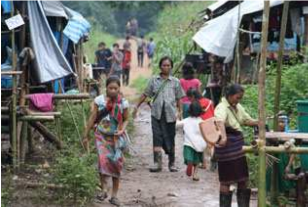
တၢ်ဒိတၢ်ဂီၤတဘျီအံၤ ဖဲ လါအီကူး ၅သီ ၂၀၀၉န့ၣ်, ဒုးန့ၣ်ဖျါဝဲ ဘၣ်ကီဘၣ်ခဲဖိဖဲအူသ့ၣ် ထၣ်ဒဲကဝီၤတၢ်လီၤသီန့ၣ်လီၤ. ဖိၣ်မ့ၣ်ပုၤလၢအထွဲတကယၤန့ၣ်မၤပုၤဝဲထံ လၢထံအပူၤလၢက ဘၣ် ကျဲတံၢ်ခိၣ်ဆူအဟံၣ်ဖိဖိအိၣ်တၢ်လီၤတၢ်လီၤသီ တၢ်ကတၢၢ်အဂၤတကယၤန့ၣ် လီၤ.