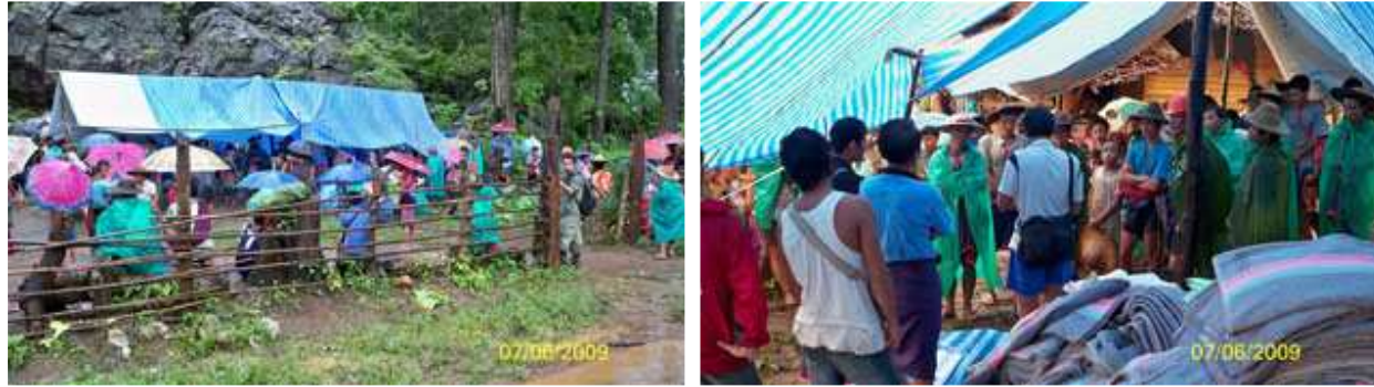
ပျားဘက်ကီဘက်ခဲ ဖျါအိၣ်ကမံၤအသိ လၢအဖဲလၢလါဂါပၤဟၤဒဲကဝီဟီၣ်ကဝီဖဲဖိအိၣ်ဂျိၣ်ပူၤ, ကညီကီဆဲး တဖၣ်ဒီးန့ၣ်ဘၣ်ပျားဘက်ကီဘက်ခဲအတၢ်မၤစၢဖဲလါယုၤ ၇သိ, ၂၀၀၉ ဖဲနီၤဘိသဝီ,ထၣ်ခိၣ်ယါကီဆၣ်,တးကီၢ်ဂျိၣ်,ကီၢ်ကျိၣ်တဲၣ်န့ၣ်လီၤ.

ဒ်ပျားဘက်ကီဘက်ခဲဖိလၢလါဂါပၤဟၤ ဟီၣ်ကဝီဖဲအဖဲန့ၣ်တုၢ်ဆူ ကျိၣ်တဲၣ်ကီၢ်ပူၤဖဲအပူၤကွၢ်တယံၣ်ဒ်ဘၣ်တဖၣ်အသိး ဖဲလါယုၤ ၁၁သိ ၂၀၀၉ နံၣ်န့ၣ် ဒိၣ်ခွၢ်ဘၣ်အုၣ်သုးရူ(၄),သုးကု(၉၉၉) သုးခိၣ်တကၤမာဲသဝီဖိလၢလါဂါပၤဟၤဟီၣ်ကဝီတကၤဖဲအုၣ်တၢ်ကစီၣ်ဒ်သိးကဆဲး ကျိးဒီးပျားဘက်ကီဘက် ခဲအသိတဖၣ်န့ၣ်လီၤ. ပျားဘက်ကီဘက်ကစီၣ်ဖိတကၤအံၤတဲဘၣ်ပျားဘက်ကီဘက်ခဲဖိလၢအဖဲယုၣ်အိၣ်လၢမံၤလးအါခံ,မံၤလး အါထၣ်ဒီးတၢ်မံၤကျါသဝီတဖၣ်လၢကဘၣ်ဆုၢ်န့ၣ် ဒိၣ်ခွၢ်ဘၣ်အုၣ်စုသဝီတဖျါစုယီၤ ၃,၀၀၀ဘး (အမဲရကၤစု ၈၈၆လၢၣ်) ဒ်သိးကဟ့ၣ် တၢ်လၢကဘၣ် လၢကစုလၢအငါဝဲပျားဘက်ကီဘက်ခဲဖိလၢအဝဲတၢ်ပိးတၢ်လိဖဲတၢ်ထီၣ်ဒုးပူၤန့ၣ်လီၤ. ပျားဘက်ကီဘက်ခဲဖိတဖၣ် တဲဘၣ်ခွၢ်အုၣ်အိၣ်ကွၢ် လၢအဝဲသ့ၣ်တဆူစုဒိၣ်ခွၢ်ဘၣ်အုၣ်ဘၣ်ဒီးအမဲအံၤအဝဲသ့ၣ်ဖဲတုၢ်တုၢ်လံာ်လၢကျိၣ်တဲၣ်ကီၢ်ပူၤလံာ်န့ၣ်လီၤ.