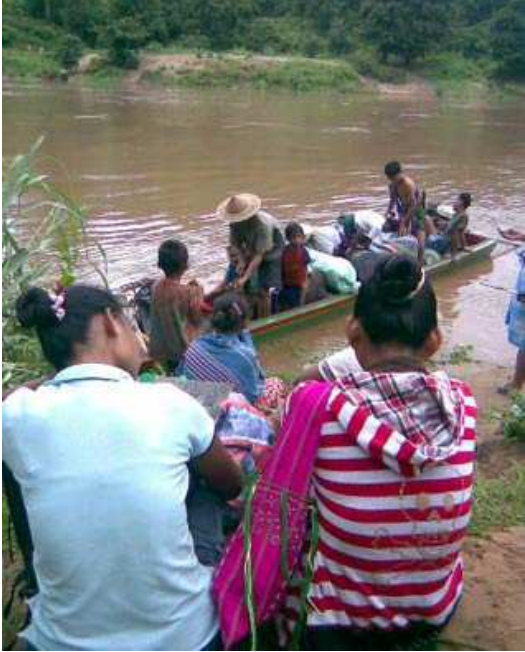
လီၢ်အိဉ်ကမ့ၢ်သဝီဖဲလၢလၢဂၢၤဟၢပုၤလီၢ်အိဉ်ကမ့ၢ်အဒဲကဝီၤတဖဉ်ဆူနီၤ အိဉ်ဒီးရဲလၢကဟးထီဉ်လၢဟီဉ်ကဝီၤဒီးကယုၤန့ဉ်ဆူ ကျီဉ်တဲဉ်ကီၢ်ပူၤ ဖဲလိယူ ၅သီ, ၂၀၀၉နံနံဒီးသိးကဟးဆူးနအဖဒီးဒံဉ်ခဉ်ဘဉ်အဉ်အတၢ် ထီဉ်ဒုးတဖဉ်န့ဉ်လီၤ.

ခဲဖဲလိယူ ၁၃သီ ၂၀၀၉နံနံအသီး တၢ်ထီဉ်ဒုးထီဒါခဉ် အဲဉ် အဲဉ်လဲ အဉ်အ သုးကလၢၤဖဲအ အိဉ်သ့ဉ်လီၤအသးဘူးဒီးလၢဂၢၤဟၢဒဲကဝီၤ လၢအမ့ၢ်ပုၤ လီၢ်အိဉ်ကမ့ၢ်ဖဲလၢဖဉ်အဉ်ကီၢ်ရှဉ်ကညီကီၢ်ဆဲးပူၤအဂီၢ်န့ဉ်လီၤ.ဒီးတၢ်ထီဉ် ဒုးလၢဘဉ်တၢ်မၤ အီၤလၢနအဖဒီးဒံဉ်ခဉ်ဘဉ် အဉ်အသုးဟံဉ်ဖိဉ် ထီဉ်အ သး န့ဉ်ဆဲးကဲထီဉ်ဒဲဒဲန့ဉ်လီၤ. တၢ်ထီဉ်ဒုးကဲထီဉ်ပဲဖဲမုၢ်ယံၢ်နံၤလိယူ ၅သီ စးထီဉ်အသးလၢတၢ်ခးစိကျိဖးဒိဉ်ပိဉ်ထွဲ ထီဉ်အသးဒီးခိဉ်တၢ်ဒုးန့ဉ်လီၤ.ဒီး တုၤလီၤလၢလိယူ ၅သီအဟါ န့ဉ်ပုၤဘဉ်ကီၤဘဉ်ခဲဖဲလၢလၢဂၢၤဟၢဒဲကဝီၤ ဒီးလၢနူသဝီတၢ်ခိဉ်တၢ်ယၢလၢအယုၤန့ဉ်ဆူ ကျီဉ်တဲဉ်ကီၢ်ပူၤတဖဉ်အ နီဉ်ဂံၢ် န့ဉ်တုၤထီဉ်ထီဉ်ဘဉ်ဆူ ၃,၀၀၀ ၁ ဘျီဉ်န့ဉ်လီၤ. လၢခိဉ်တၢ်ဒုးတနီၤဒံဉ်ခဉ် ဘဉ်အဉ်ဟဲ ထီဉ်ဟူးဂဲၤလၢတၢ်မဲဉ်ညါဒီးနအဖန့ဉ်အိဉ်လၢတၢ်လီၢ်ခဲဒီးခးစိ ကျိဖးဒိဉ် န့ဉ်လီၤ. တကတီၢ်ယီဖဲမုဉ် အိဉ်ဘူး လိယူ ၇သီ နအဖဒီးဒံဉ်ခဉ် ဘဉ်အဉ် ဟံဉ်ဖိဉ်ထီဉ်သး ဟဲထီဉ် ဝဲ ဆူခဉ်အဲဉ် အဲဉ်လဲ အဉ် တၢ်လီၢ် သုး ရှဉ် (၂၀၂) လၢဂၢၤဟၢကလံၤစိးတၢ်ဘဉ်စၢၤကအိဉ်အ ကံ လီ ၃၀ ဒီး ခး လီၤ ကျိဖးဒိဉ်ဆူခဉ်အဲဉ်အဲဉ်လဲအဉ်အသုးကလၢၤဖဲန့ဉ်စ့ၢ်ကိးလီၤ.