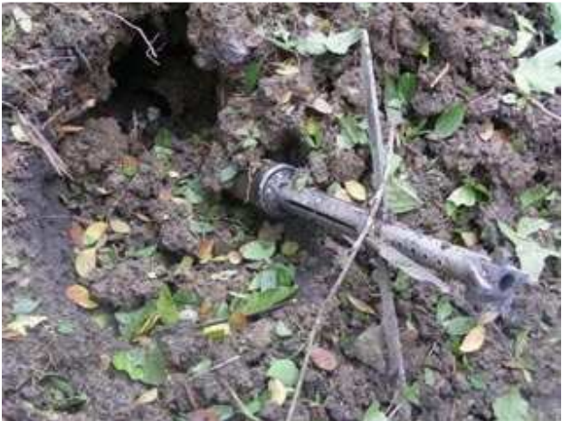
ကညီတံဉ်ကစီဉ်ကမံးတံး (ခွပ်အုတ်စံဉ်) ဟ်ဖျါ ထီဉ်တံဉ်ဂီ၊ တဘုဉ်အါဒီးထဲဖျါ ထီဉ်ဝဲလါမှီ RPGs တကလုာ်လါနအဖဒီး နှပ်ခွပ်ဘုံအုတ်ဟ်ဖိုဉ်ထီဉ်သး ခးလါ၊ ဖဲလါယူ၊ စသီ နှပ် လါအလါတံဉ်ဖဲနီ၊ ဘိသဝီပူ (နီ၊ ဘုဉ်) ဖဲ ကိုဉ်တံဉ်ကီပူ၊ နှပ်လီ၊ (တံဉ်ဂီ-ခွပ်အုတ်စံဉ်)

ဖဲလါယူ၊ စသီ၊ မှီဆင်နံ၊ နှပ်၊ RPGs သည် သာယျာဉ်လှာ မှီ နအဖ ဒီး နှပ်ခွပ်ဘုံအုတ်ဟ်ဖိုဉ်ထီဉ်သးခးဝဲ ခွပ်အံဉ်အံဉ်လ်အုတ် အသး ကလာ၊ ဒီးလါတံဉ်ဝဲလါနီ၊ ဘိသဝီပူ၊ ဖဲထါစီဉ်ယါ ကီဆင် တး ကီရုဉ်၊ ကိုဉ်တံဉ်ကီပူ၊ နှပ်လီ၊ ကညီတံဉ်ကစီဉ်ကမံးတံးဟ်ဖျါ ထီဉ်ဝဲဒေဉ်တံဉ်ဂီ၊ တဘုဉ်လါအမှီ RPGs အချံဒ်တံဉ် ဟ် ဖျါ ထီဉ် တုာ်ဝဲလါအလါတံဉ်ဖဲနီ၊ ဘိသဝီပူ၊ ဖဲလါယူ၊ စသီ အ နံ၊ နှပ်လီ၊ ခွပ်အုတ်အုတ်ကွံဉ်မာလါတံဉ်ဟ်ဖျါ ထီဉ်ဝဲတံဉ်တုထုးထီဉ် RPGs တ ကလုာ် အံ၊ အခိဉ်ထံးခိဉ်ဘိတနုာ်ဘုဉ်ဆင် ခွပ် အုတ်စံဉ် (ကညီတံဉ် ကစီဉ်ကမံးတံး) ဘုဉ် သုဉ်သုဉ်ကဟ် ဖျါဝဲ လါဘုဉ်တံဉ် တုထုးထီဉ် ဝဲလါတရူး အက လုာ်-ဖဲဇုနုဉ်လီ၊ နှပ်ခွပ်ဘုံ အုတ် သးသုဉ်တ ဖဉ်ဖဲအပူ၊ ကွံဉ်ခးစိကျိဖဉ်ဒိဉ် RPGs တကလုာ်ယိအံ၊ ဆူထံပာ၊ ခံသဝီဖဲတံဉ်ကြိုကီဆင် ဖဉ်အုတ်ကီရုဉ်ပူ၊ ဖဲအိဉ်ကထိဘုဉ် ၂၀၀၈ နှပ် နှပ်လီ၊ ဖဲ လါယူ၊ ၁၀သီ အနံ၊ ကျိဖးဒိဉ် သုဉ် (မှီမိ ထဉ်မှတမှီ RPGs သုဉ်) လါတံဉ်အါထီဉ်လှိုဉ်ဖျါဉ်ဖဲအဘူးဒီးမာ တရူးသဝီလါအအိဉ် ဖဲ ထါ စီဉ်ယါ ကီဆင်၊ ကိုဉ်တံဉ်ကီ ပူ၊ နှပ် လီ၊ ကျိဖးဒိဉ်သးလါတံဉ်ဖဲလါယူ၊ ၁၀သီနံ၊ အကျါတဖျါဉ်နှပ် လါတံဉ်ဘူးဝဲဒီးမာတရူးကျိ (မှီလါဟ်ကစီ၊ ပူ၊ ဘုဉ်ထွဲကျိတံဉ်ပဒိဉ်ကျိတဖျါဉ်) ဘုဉ်ဆင်တဟ်ဖးထီဉ်ဘုဉ်၊ အဂါခံဖျါဉ်နှပ်ပီထီဉ်လါမာ တရူးသဝီဖဲအပ ထီးကျိး အပူ၊ ဘုဉ်ဆင်တံဉ်ဘုဉ်ဒိဘုဉ်ထံးတအိဉ်နီတဂါဘုဉ် နှပ်လီ၊ လါလါယူ၊ ၁၀သီ ၂၀၀၉ နှပ်လံ၊ လါ၊ မာတရူးလူ၊ ကို လါအိဉ်ဖဲမာတရူးသဝီပူ၊ တုဉ်ကွံဉ်အသးခိဖျါလါတံဉ်ဘုဉ်ယးဒီးတံဉ်ဘုဉ်ယိဉ်လါနအဖကဆဲးခးလါဒီးကျိဖးဒိဉ်ဒီး နှပ်ခွပ်ဘုံအုတ်အသးဖိ ကစိကယိထံကျိနှပ်လီ၊ မာတရူးသဝီဖဲလါအမှီကညီ-ကိုဉ်တံဉ်ဖိတဖဉ်ဘုဉ်ယိဉ်ဝဲလါနှပ်ခွပ်ဘုံအုတ်သးဖိကစိကီဆင်အါဒီးဖဲ နှပ်လါ သဝီပူ၊ နှပ်လီ၊ မာတရူးသဝီဖဲတဂါမံးဝဲ