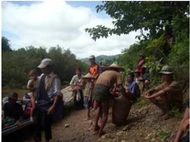
ပုၤလီၤအိၣ်ကမ့ၢ်သဝီဖိလၢလၢဟံၣ်ဖျါဒဲကဝီၤလၢယုၤထီၣ်ဆူကီၢ်ကီၣ်တဲၣ်မုၢ်လၢအဝဲသ့ၣ်ဘၣ်ထီၣ်တၢ်လၢအတၢ်ဘၣ်တၢ်ဘၣ်အဂီၢ်ဖဲန့ၣ်အဖဵုဒီးခိၣ်ခ့ၣ်ဘၣ်အုၣ်သုးတဖၣ်ဟံၣ်ဆိလီၤအါထီၣ်သးဖဲဟီၣ်ကဝီၤပူၤအါန့ၣ်လီၤ.

ဖဲမုၢ်ဖိဖး, လၢယုၤထီၣ် ၅သီ, ၂၀၀၉န့ၣ်န့ၣ်, သဝီဖိလၢတၢ်ကြံၣ်ကီၢ်ဆၣ်လၢဖဵုအုၣ်ကီၢ်ရၣ်ပူၤတဖၣ် ဃုၢ်ထီၣ်ဆူကီၢ်ကီၣ်တဲၣ်ဒ်သီးကဟးဆုးဝဲန့ၣ်အဖဵုဒီးခိၣ်ဖျါဘိတၢ်ထီၣ်ဒုးန့ၣ်လီၤ. သုးဖိကအိၣ်ဝဲ ၂၅၀၈၂ယၣ်ယၣ် လၢန့ၣ်အဖဵု ၁၆၅ (၂၀၂)ဒီး(၂၀၅)ဒီးခလရ(၈၁)ဒီးခိၣ်ဖျါဘိသုးက့ (၉၉၉) ဟံၣ်ထီၣ်ဝဲခ့ၣ်အဲၣ်အဲၣ်လၢအုၣ် (၁၀၀), (၂၀)ဒီး(၂၂)အတၢ်လီၤန့ၣ်လီၤ. တၢ်ဒုးဒ်အံၤသ့ၣ်တဖၣ်ဖျါလၢကမ့ၢ်ဝဲန့ၣ်အဖဵုဒီးခိၣ်ခ့ၣ်ဘၣ်အုၣ်အတၢ်ဟူးတၢ်ဂဲၤထီၣ်ခိၣ်အဲၣ်အဲၣ်လၢအုၣ်တၢ်လီၤတၢ်ကျဲလၢဖဵုအုၣ်ဒီးပုၤပျံာ်ယၣ်အပူၤ တချုးဒီးလၢ ၂၀၁၀ တၢ်ယုၤထီၣ်လၢကီၢ်ပယီၤပူၤဟံၣ်ဒီးဘၣ်အါန့ၣ်လီၤ.