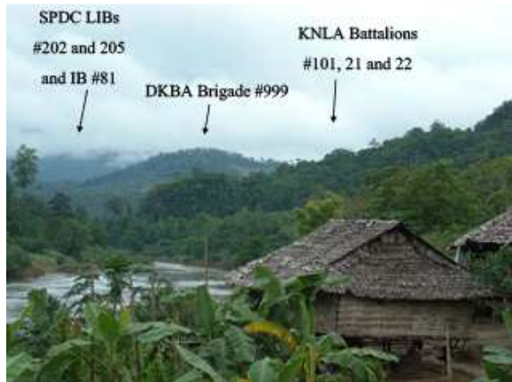
တၢ်ဂီၤတဘျီအံၤဒုးန့ၣ်ဖျါဝဲနအဖဒီးဒံၣ်ခွန်အိုင်အိုင်သုးကလၢလၢအဖျါလၢတၢ်လီၤခဲန့ၣ်လီၤ. လၢတၢ်မိၢ်ညါန့ၣ်မ့ၢ်ဝဲဟံၣ်လၢလၢဂၢၤဟၢဒဲကဝီၤပူၤလၢပုၤနီၢ်ဂံၢ်ကအိၣ်ဝဲ ၁၂၀၀ဂၢၤန့ၣ်လီၤ. လၢလၢဂၢၤဟၢ ဒီးနအဖ/ဒံၣ်ခွန်အိုင်အိုင်ဒဲကဝီၤအဘျီစၢန့ၣ်အိၣ်ဝဲဒီးခွန်အိုင်အိုင်လ်အုၣ်တၢ်လီၤလၢပုၤဝဲထံနီၤဖးတၢ်အါဂၢၤဆီကမိၣ်ဝဲလၢတၢ်ကထီၣ်ဒုးအီၤဖဲအဆီအချူန့ၣ်လီၤ. (တၢ်ဂီၤတဘျီဝဲဒီးယၢ်ကရူၢ်)

ခွန်အိုင်အိုင်လ် သုးရုဂ် (၁၀၁), (၂၁)ဒီး(၂၂)သုဂ်တဖၣ်န့ၣ် အိၣ်ဆီလီသးဘူးဒီးလၢဂၢၤဟၢ, ပုၤလီၤအိၣ်ကမ့ၣ်ဒဲကဝီၤလၢအအိၣ်သုၣ်လီၤသးဖဲကီၢ်ကိၣ်တဲၣ်ကီၢ်ဆၢန့ၣ်လီၤ. ခဲအံၤဒဲကဝီၤတဖျၢၣ်အံၤအပူၤပုၤနီၢ်ဂံၢ်ကအိၣ်ဝဲ ၁,၂၀၀ဂၢၤဒီးအါတက့ၢ်မ့ၢ်ဝဲသဝီဖိလၢအယုၢ် တၢ်ထီၣ်ဒုး ဒီးတၢ်မၤပယုၤလၢဖၣ်အၣ်ကီၢ်ရုၣ်ပူၤန့ၣ်လီၤ. နအဖဖဲမၤအါထီၣ်သုးတၢ်အါဖျါလၢကထီၣ်ဒုးဝဲခွန်အိုင်အိုင်လ်အုၣ်တၢ်လီၤန့ၣ်လီၤ. ဝဲသုးဖိ ၂၀၀ဂၢၤလၢသုးကျိၤလွံၢ်ကျိၤလၢနအဖဖဲမၤ (၂၀၂)ဒီး(၂၀၅)ဖဲတုၤလၢတၢ်လီၤတၢ်အိၣ်အဝဲသုၣ်စးထီၣ်ဟူးဂဲၤဝဲကျဲၣ်မိၢ်ခံ, ကျဲၣ်ဖိခံ, မဲၢ်လးအါ, မဲၢ်လးအါခံ, စံၣ်ဖိခံ, ထံကဟီ, ဒီးဝဲခဲကျိၤသဝီန့ၣ်လီၤ. သဝီသုၣ်တဖၣ်အံၤလဲလၢအိၣ်ဝဲလၢဝဲခဲကျိၤကရူၢ်ပူၤ, တၢ်ကြဲၢ်ကီၢ်ဆၢန့ၣ်လီၤ. တၢ်န့ၣ်ဝဲအါလီၤ ဝဲ ၂၀၀၉န့ၣ် လၢယုၤ ၂သီအနံၤန့ၣ်, သဝီဖိလၢသဝီသုၣ်တဖၣ်အံၤစးထီၣ်ပုၤထီၣ်ဝဲဆူကီၢ်ကိၣ်တဲၣ်မ့ၢ်လၢအဝဲသုၣ်ပျဲၤလဲလၢတၢ်ဒုးမ့ၢ်ကဲထီၣ်သပုၤကတၢ်န့ၣ်, နအဖဒီးဒံၣ်ခွန်အိုင်အိုင်ကမၤအဝဲသုၣ်ကဲပုၤဝဲတၢ်ဖိမ့ၢ်ပုၤရဲမ့ၢ်ပီၤန့ၣ်လီၤ.