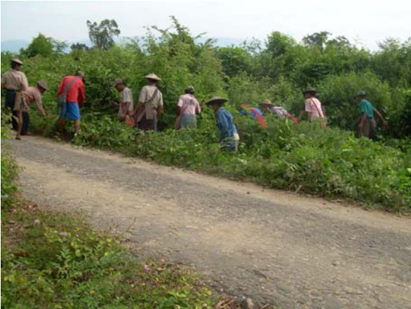
သဝီဖဲလၢ ကူၤစ့ၤ ဟံၣ်ကစိၤလၢမုာ်တြီၤကီၢ်ရၢၢ်အပူၤလၢကကျိပျီၣ်နီၣ်လၢအမဲထီၣ်လၢနအဖ အသိလ့ၣ်ကျဲကပၤ ဖဲဘုသိၣ်ကီၢ်ဆၢအပူၤဖဲ လါနီၣ်ဝုၤဘၣ် ၁၁သီတုၤလၢ ၁၂သီဒ်နအဖ ခိၣ်ရၢၢ်သးရၢၢ် (၄၃၄) အသးရၢၢ်ခိၣ်အိၣ်ထီၣ်လ့ၣ်ဟ့ၣ်လီၤတၢ်ကလုာ်အသိးန့ၣ်လီၤ. (တၢ်စိး ကညီၣ်ဝါဒိခွဲးယာ်ကဂူၢ်)

“ အဝဲသ့ၣ် (နအဖသး)တပုၤလၢအဝဲသ့ၣ်ကဘီထီၣ်သးအဒိဒီးတီးလၢသးတၢ်လီၤန့ၣ်လီၤ. ပုၤသဝီဖဲလၢကျိးထၣ်, နူဘီခိၣ်ဒီးခးဒုခိၣ်ဘၣ်မၤတၢ်တမံးဃီဒ်သိးပုၤလီၤ. ပဘၣ်မၤတၢ်လၢအဝဲသ့ၣ်အဂီၢ်လၢတန့ၢ်ဘၣ်အဘူးအလဲနီတမံးဘၣ်လီၤ. ပဘၣ်ကျိဝၣ်ဒီးကဟဲလၢဒီးလဲၤဆူန့ၣ်အဝဲသ့ၣ်တန့ၢ်သၢကျိလ့ၢ်ဒီးပဘၣ်လဲၤကျိပျီၣ်စၢ်ကိးသိလ့ၣ်ကျဲ (ကပၤ) န့ၣ်လီၤ. ဒ်ညီၣ်န့ၢ်အသိး ပဘၣ်မၤပျီၣ်အိး တန့ၢ်ခံာ်ကျိန့ၣ်လီၤ. ခဲအံၤပကဘၣ်စးထီၣ်မၤပျီၣ်ကျဲဖဲ လါနီၣ်ဝုၤဘၣ် ၁၂သီ န့ၣ်လီၤ. ပဘၣ်စးထီၣ်ဟံးမူဒါမၤပျီၣ်ကျဲစးထီၣ်လၢ ကျဲလၢအအိၣ်လၢ သဝီ ဖ-----ဒီး သဝီန-----အဘၢၣ်စၢၤန့ၣ်လီၤ.”