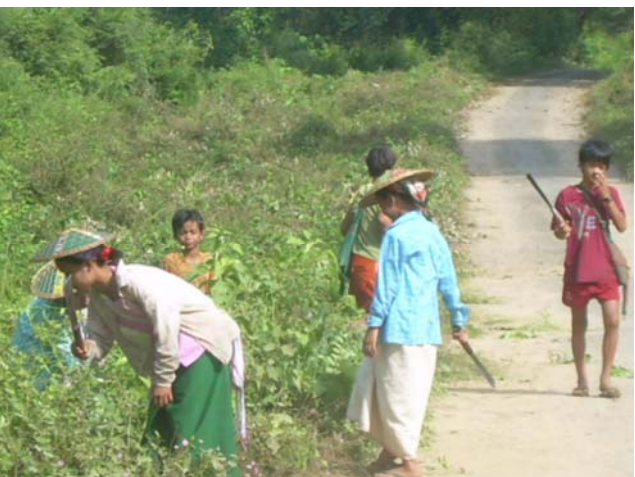
ပူၤပိၣ်မ့ၢ်ဒီးဖိဒိဖိသ့ၣ်တဖၣ်မၤဝဲ လိၣ်အါပုဒ်အမ့ၢ် တၢ်မၤကျိၣ်တၢ်ပိးဝဲၣ်လၢသိ လုၣ်ကျဲၤကပိၣ်ကပၤ လၢကူဆုဟီၣ်ကဝီၤလၢလၢနီၣ်ဝဲဘၣ်၁၂သီ, ၂၀၀၇န့ၣ်ဒ်နအဖဖိၣ်ချ သးရှၢ် (၄၃၄) သးရှၢ်ခိၣ်အီၤထီၣ်လ့ ဟ့ၣ်လီၤတၢ်ကလုၢ်အသိးန့ၣ်လီၤ. (တၢ်ဒီး ကညီ ဂၢ်ဒီးယၢ်ကရှၢ်)

ကလံၤသိၣ်ဂီၢ်တၢ်အိၣ်သးလၢကညီကီၢ်စၢ်ပူၤန့ၣ် နးဝဲဒိၣ်မးတုၤ ဒုၣ်လဲၣ်လၢတၢ်ဖဲတၢ်မၤအကလုၣ်ကလုၣ်ဘၣ်တၢ်ပတုၣ်က့ၤအီၤ လီၤ. ပဝဲသ့လၢတၢ်မၤဆူၣ်မၤစိး တနီၤနီၤန့ၣ်ဘၣ်တၢ်တြီၤယၢ် အီၤလၢတၢ်ကီၢ်တၢ်စူၤကလံၤသိၣ်ဂီၢ်အတၢ်အိၣ်သးန့ၣ်လီၤ. လၢ တၢ်န့ၣ်အယီၤ ဝဲတၢ်ယီၤအကတီၢ်တုၤယီၤကဒီးဝဲ ဝဲလၢနီၣ်ဝဲဘၣ် ယၢ်ယၢ်န့ၣ် တၢ်မၤဆူၣ်မၤစိးအတၢ်ရဲၣ်တၢ်ကျဲၤအါကလုၣ်အါမ့ၢ် လၢအဘၣ်တၢ်ပတုၣ်က့ၢ်အီၤ ဝဲတၢ်စူၤအဆၢခါကတီၢ် စးထီၣ်က ဒီးဝဲဒုၣ်န့ၣ်လီၤ. ဝဲကျဲၤသ့ၣ်တဖၣ်ယုထီၣ်ကဒါက့ၤအခါန့ၣ် နအ ဖ အသးခိၣ်သ့ၣ်တဖၣ်မၤဆူၣ်မၤစိး ကဒီးဝဲသဝီဖိသ့ၣ်တဖၣ်န သိးကစးထီၣ်ကဒါတၢ်ဖဲတၢ်မၤလၢအမၤစၢၤသးအတၢ်ရဲၣ်တၢ် ကျဲၤလၢဟီၣ်ကဝီၤအပူၤန့ၣ်လီၤ. သးသ့ၣ်တဖၣ်ဟ့ၣ်လီၤတၢ်က လုၣ်လၢပူၤကဟဲစိၣ်န့ၣ်အဝဲသ့ၣ် ကဟံလုၣ်ဒီးဝဲ, မၤပျီကျဲၤ ဘျီ ဂ့ၤထီၣ်က့ၤသးတၢ်လီၤ, ကျိက့ၤသ့ၣ်ဝဲလၢအဝဲထီၣ်လၢတၢ်စူၤ ခါသ့ၣ်တဖၣ်ဒီးလဲၤဝဲဆုၢ် အါထီၣ်တၢ်အိၣ် တၢ်အီၤန့ၣ်လီၤ. သး သ့ၣ်တဖၣ် ဒီးသန့ထီၣ်သးလၢတၢ်မၤဆူၣ်မၤစိး သဝီဖိသိးက မၤတၢ်ဒ်အံၤသ့ၣ်တဖၣ်လီၤ. ပူၤဝဲတၢ်ဖိ, ပူၤခိးတၢ်ဖိဒီးပူၤမၤတၢ် ဖိလၢတၢ်သ့ၣ်ထီၣ်လီၤသ့ၣ်တဖၣ်ဘၣ်တၢ်ယုထီၣ်ဝဲဒီးဆုၢ်လီၤလၢ ကမၤတၢ်အဂီၢ်လီၤ.